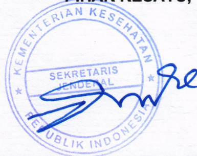
KUNTA WIBAWA DASA NUGRAHA